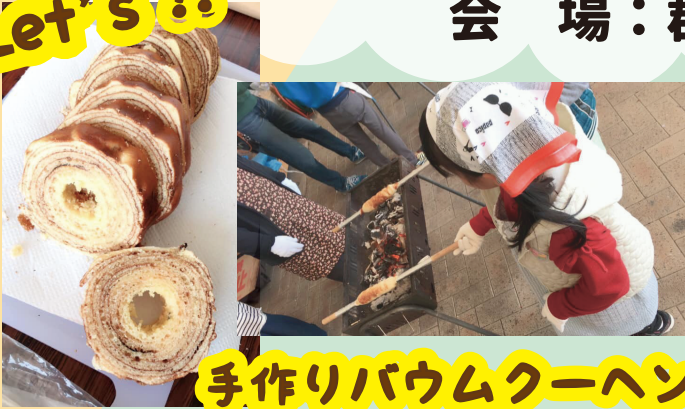
手作りバウムクーヘン♪