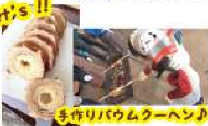
手作りパウムクーヘン♪